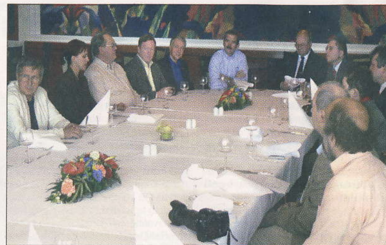
Zleva Viktor Savinych, tlumočnice, Bo Bobko, Richard Richards, Charlie Walker, Christ Hadfield a Vladimír Remek

Základním nástrojem poslání ASE jsou celosvětové kongresy, které v hostitelské zemi slouží