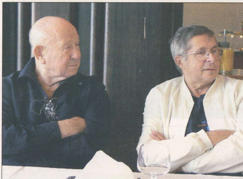
Kosmonauté Alexej Leonov a Viktor Savinych

o kosmonautiku, vědění, rozvoj lidského ducha a poznávání fyzikálních a společenských zákonitostí.